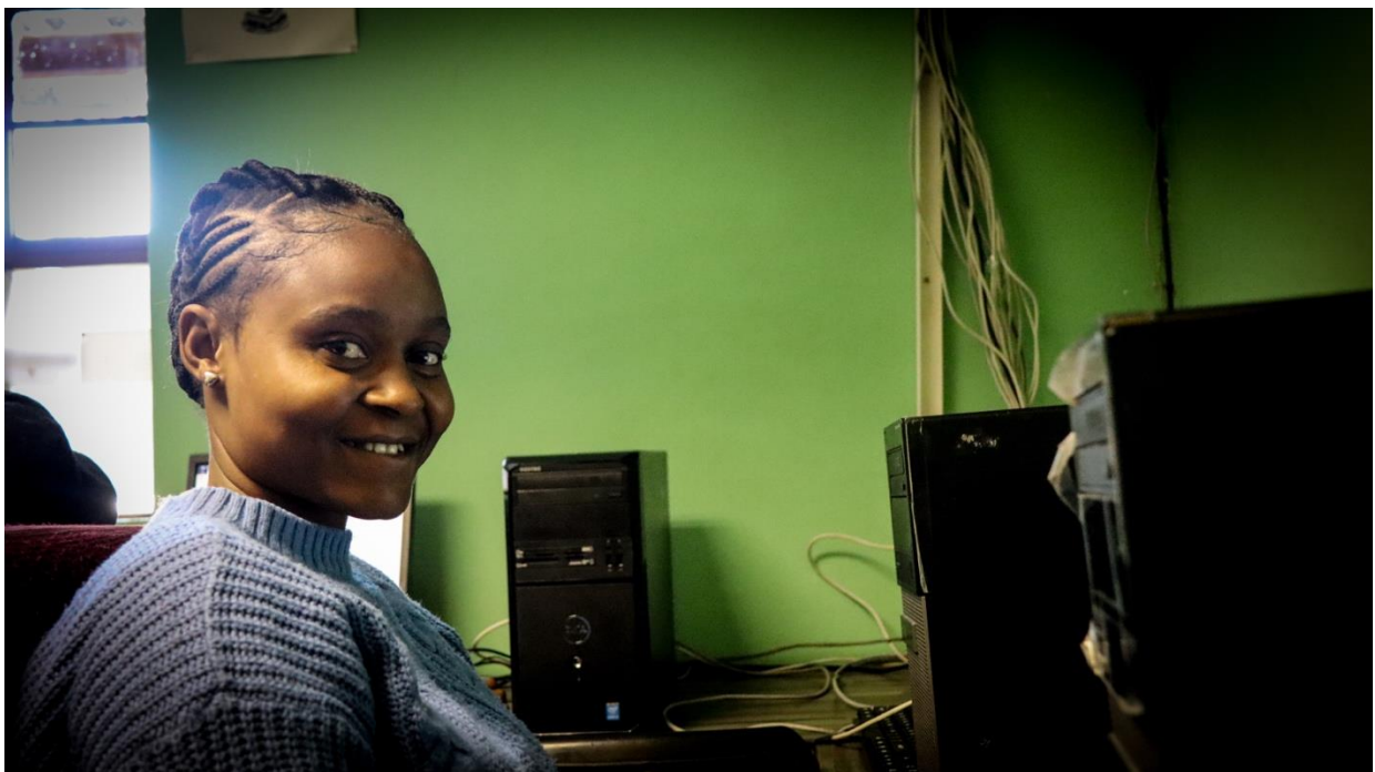
Foto: een ICT student van het Themba Project heeft nu hoop op een betere toekomst.

Sinds eind 2022 heeft Themba zich als project ook verder ontwikkeld, waar we in samenwerking met Net4Kids en Grizzly New Marketing een tweede fase in het project ontwikkeld hebben. Aan de hand van een uitbestedingsmodel hebben we nu jongeren in Zuid-Afrika in Search Engine Optimisation (SEO) en besteden we deze jongeren na afronden van de training uit aan Grizzly New Marketing, om voor deze organisatie vervolgens klanten in Nederland en Amerika te helpen met SEO. Dit hebben we sindsdien uitgebreid naar SEO en Cyber Security. In Zuid-Afrika bieden we ook veel jongeren betaalde stageplekken uit door middel van verschillende leer en werkplaats programma's.