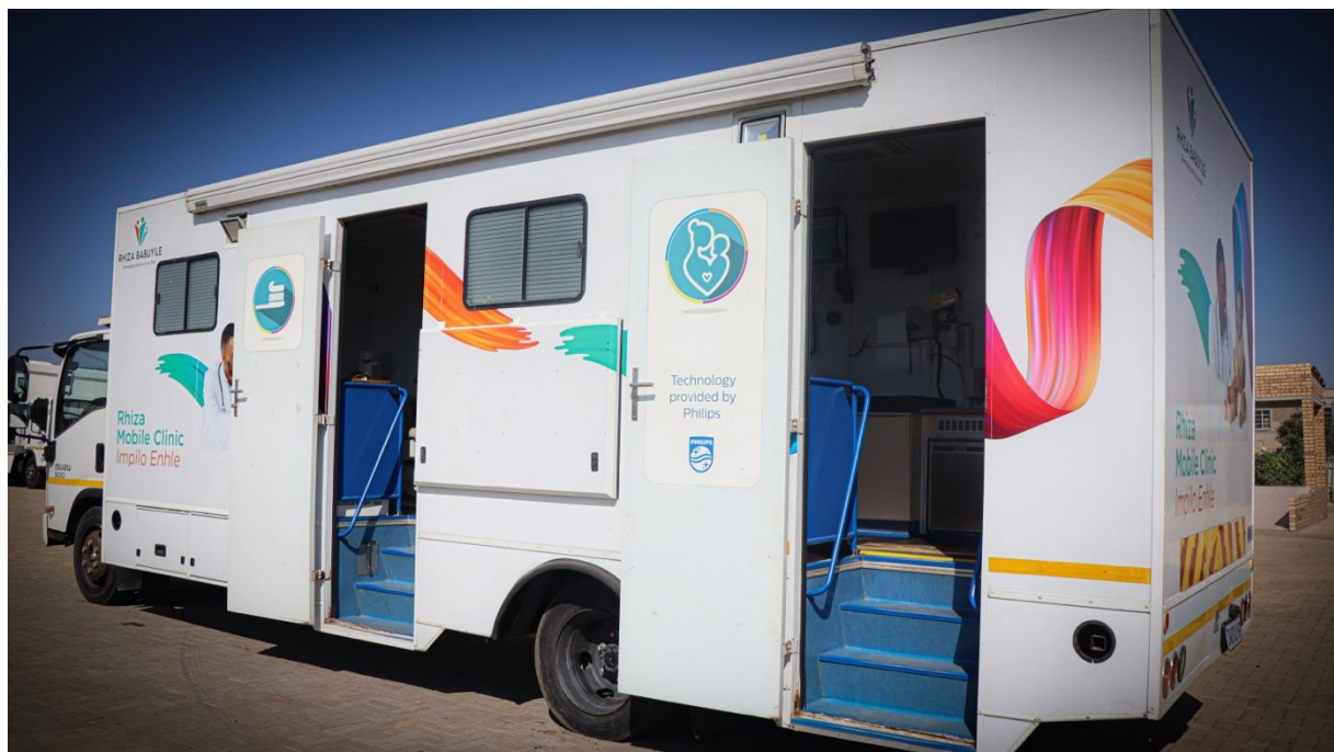
Foto: onze eerste MMK die we in 2015 openen is nog steeds actief in Zuid-Afrika.

Het doel is om de MMKs ook in te gaan zetten voor gespecialiseerde diensten in te gaan zetten, bijvoorbeeld één van de MMKs kan radiologische diensten aanbieden, terwijl een andere zich richt op cardiologie. Dit kan ervoor zorgen dat de MMKs meer waarde toevoegen aan de Mpathy klinieken en helpt ook met de zelfredzaamheid van de MMKs.