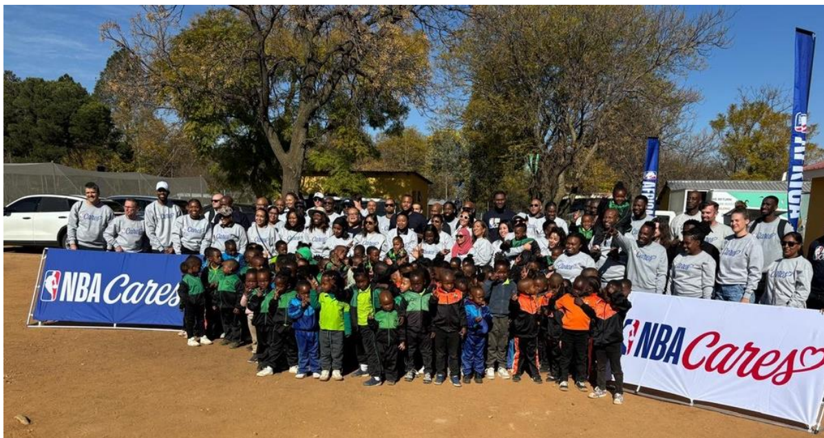
Foto: een groot deel van het Rhiza team gedurende een evenement met de NBA in Diepsloot, ZA.