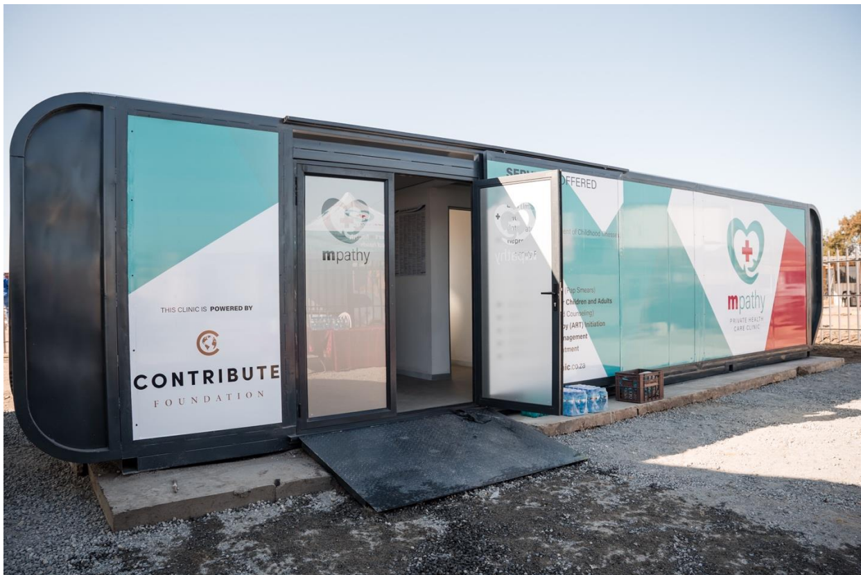
Foto: één van de Mpathy klinieken in Marikana, Northwest Province in Zuid-Afrika.

Het doel is om in totaal minimaal 70 klinieken te starten in de komende vijf jaar en een miljoen patiënten per jaar te zien.