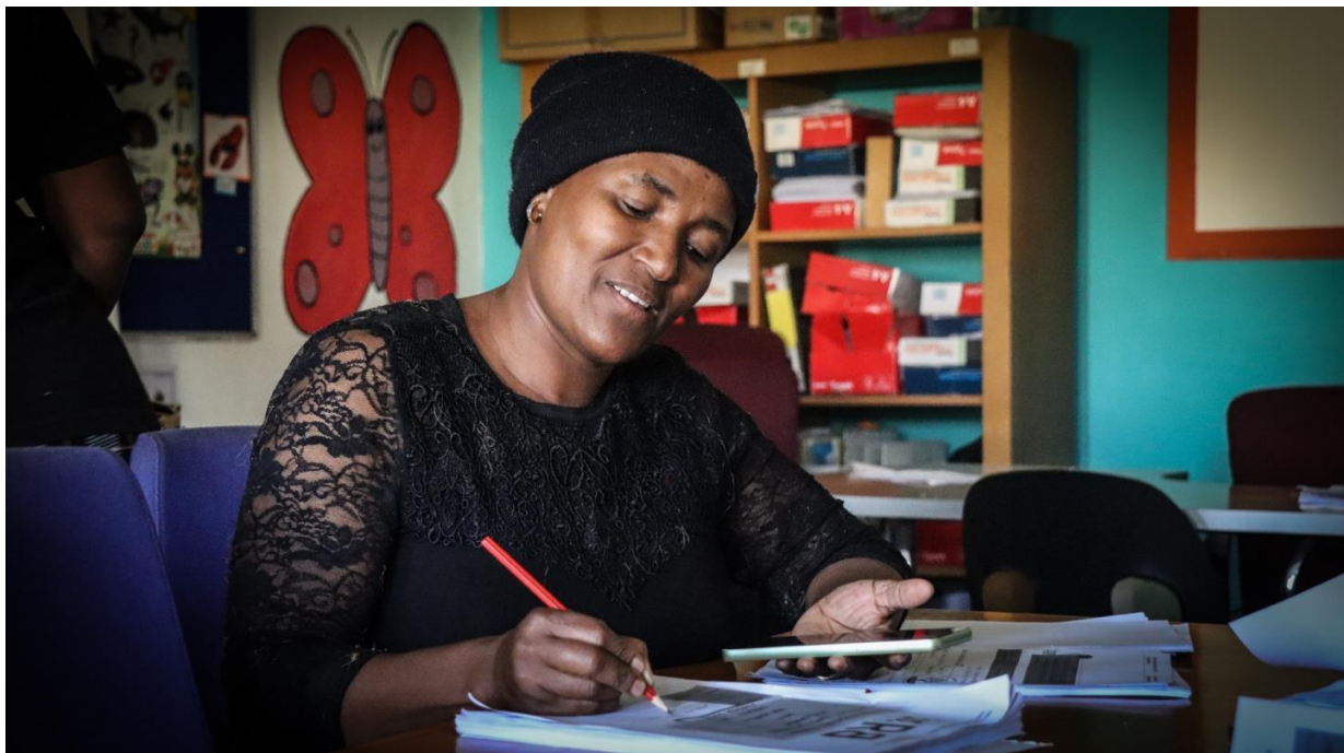
Foto: een kleuterschoolhoofd leert over kleuteronderwijs en ondernemerschap.

Momenteel voert Stichting Rhiza alleen nog in Afrika projecten uit en is de doelstelling van de stichting “Ieder Kind naar School” uitgegroeid naar “Building Strong Communities”. Op basis van de opgedane kennis en ervaring, hebben we geleerd dat onderwijs op zichzelf, ondanks dat het vele problemen op termijn kan oplossen, niet de oplossing is voor de sociale problemen in Afrika. Kinderen die ziek zijn kunnen niet optimaal van onderwijs profiteren met als gevolg dat ze later niet naar het voortgezet onderwijs of de universiteit kunnen. Datzelfde geldt voor kinderen waarvan de ouders geen stabiel inkomen hebben. Dit is de reden dat Stichting Rhiza in 2014 naast onderwijs ook projecten is gestart in gezondheidszorg, beroepsgerichte opleiding en training voor ondernemerschap. Door onze programma’s op het gebied van gezondheidszorg, onderwijs, beroepsgerichte trainingen en ondernemerschap in één leefgemeenschap te implementeren, spelen we in op de behoeften van de leefgemeenschappen en zorgen wij er tevens voor dat een project binnen drie tot tien jaar zelfredzaam is.