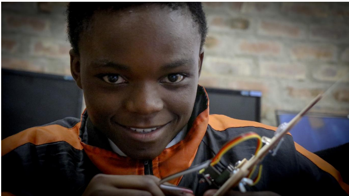
Foto: blijde kinderen bij één van de door Rhiza verbouwde scholen.

Op dit moment worden de Leaphy robotica lessen alleen in Johannesburg en Kaapstad op twee scholen gegeven. Ons doel is om dit significant uit te breiden zowel binnen Zuid-Afrika, als ook in andere landen in Afrika.