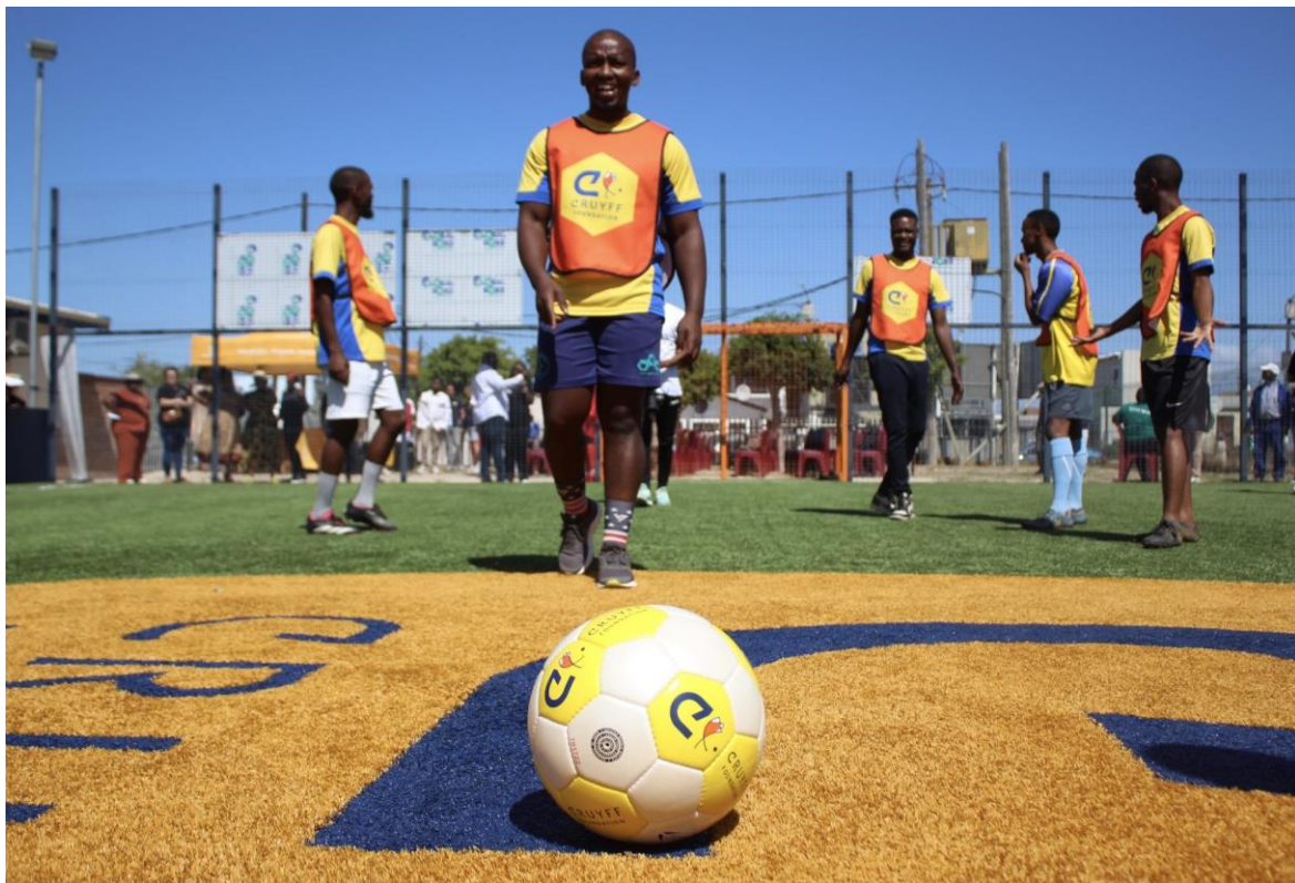
Foto: sportende jongeren op één van de Cruyff Courts in Johannesburg.

Dit programma is in 2023 gestart met een pilot programma in Johannesburg. Dit breidt zich momenteel uit naar een tweede MBK en met de start van twee Cruyff Courts per jaar in Zuid-Afrika. Een holistische kijk op gezondheidszorg, inclusief gezond eten, sporten en toegang tot klinieken moet ervoor zorgen dat de levensverwachting in onze leefgemeenschappen omhooggaat en ziekteverzuim, alsmede bijvoorbeeld tienerzwangerschappen omlaaggaan.