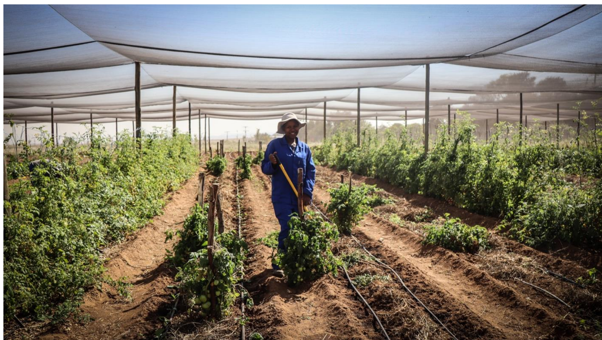
Foto: één van onze agripreneurs is hard aan het werk om een duurzaam inkomen te genereren.