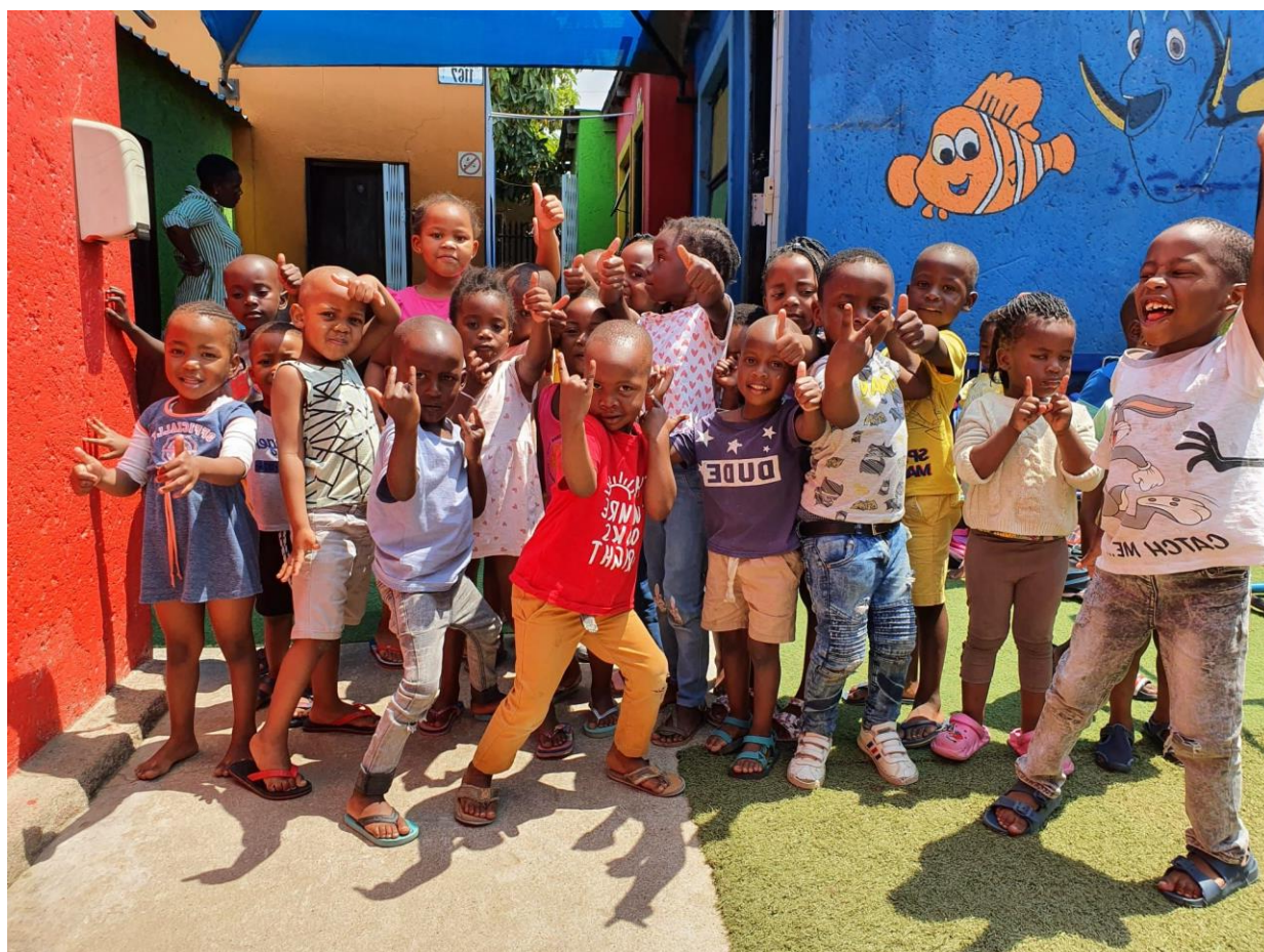
Foto: blijde kinderen bij één van de door Rhiza verbouwde scholen.

Om betere zelfredzaamheid van dit project te bevorderen hebben we een financieel product voor kleuterscholen ontwikkeld. We geven kleuterscholen leningen tussen de €100 en €20,000 ten behoeve van de verbetering van de infrastructuur, speelplaats, of lesmateriaal. Scholen krijgen de rente van de leningen terug van een externe partij, indien de resultaten van de kinderen verbeteren.